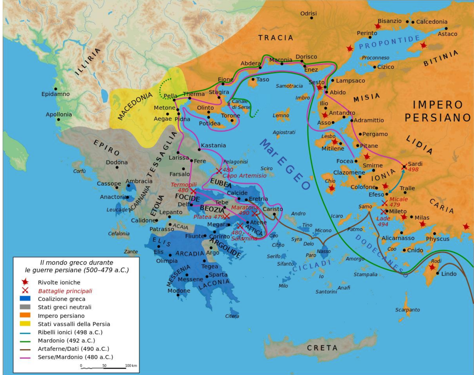
Il mondo greco durante le guerre persiane (500-479 a.C.)